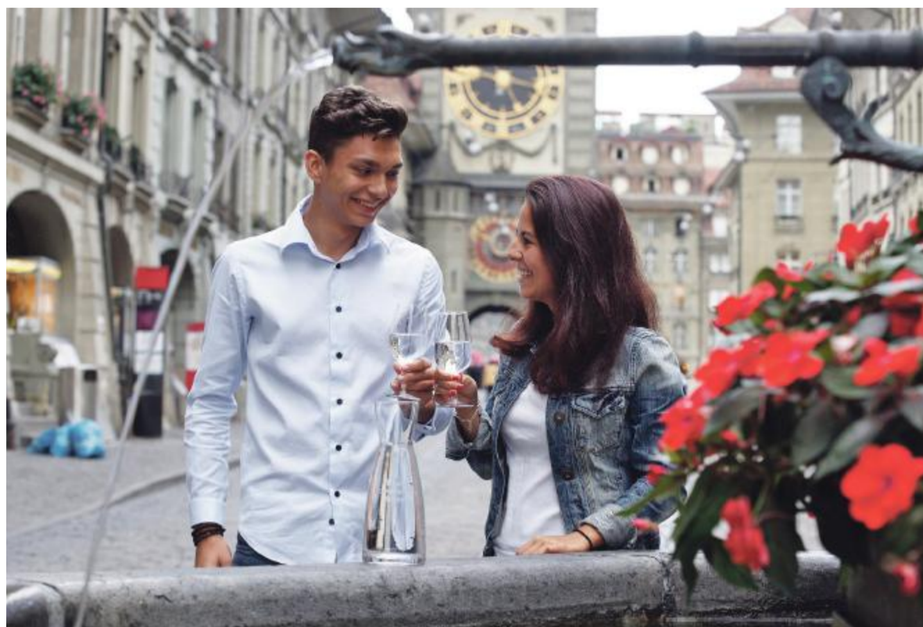
Brunnen-statt Flaschenwasser: Pressebild der Stadt Bern anlässlich des Beitritts zur Blue-Community-Initiative.

Tatsächlich wäre in diesem Punkt das Engagement der Blue-Community-Initiative in der Schweiz nicht nötig. Die Initianten wollen aber auch die Nutzung